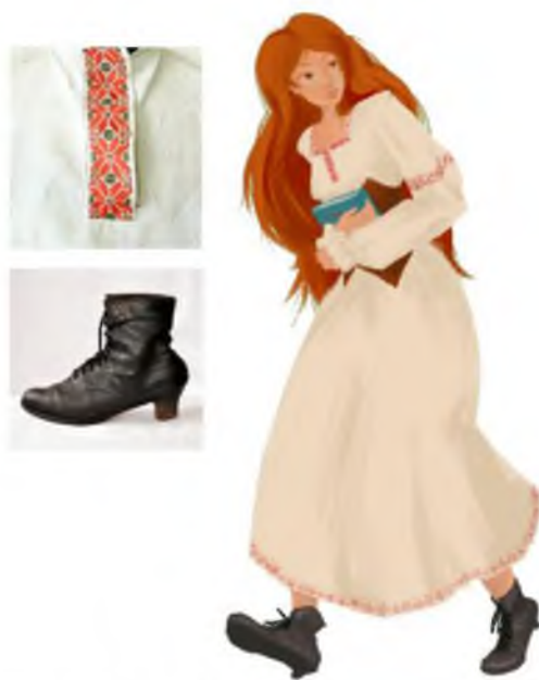
Рис. 2. Решение персонажной графики на базе этнографических экспонатов

Концепция проекта этно-новеллы представляет исследование культурного наследия. Этно-новелла как дизайн-продукт использует язык современной типографики, композиции, колористики и сторителлинга для реконструкции культурной логики [5]. Это визуальное высказывание, способное транслировать сложные культурные смыслы доступным, современным и эмпатичным языком. Персонажи новеллы и окружение представляют художественную реконструкцию, в основе решения которой лежат исторические образцы (рис. 2).