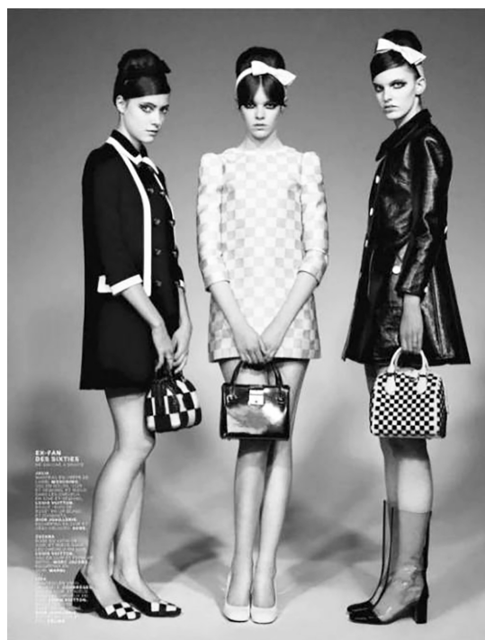
Рисунок 2 – Коллекция Мэри Куант, 1960-е 2