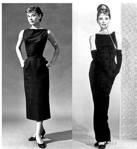
Рисунок 3 – Одри Хепберн 3

Одри Хепберн, икона кинематографа, оставила неизгладимый след в истории моды и кино, став воплощением изысканной элегантности. Ее роль в культовом фильме 60-х «Завтрак у Тиффани» стала знаковым моментом, где она мастерски сыграла многогранный образ наивной девушки. Этот фильм, наряду с самой Одри, оказал колоссальное влияние на мир моды, породив тренды на облегчающие черные платья, утонченные прически и жемчужные украшения, которые до сих пор актуальны (рис. 3) [3].