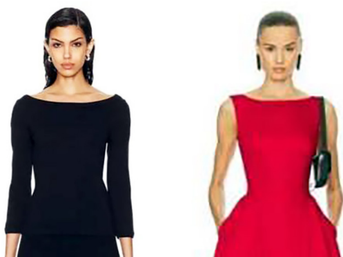
Рисунок 11 – Примеры вырезов «лодочка» 6

и свободные формы продолжают вдохновлять дизайнеров и модников по всему миру. Современное ретро не просто копирует элементы эпохи, но и переосмысляет их, адаптируя к актуальным трендам и технологиям [9].