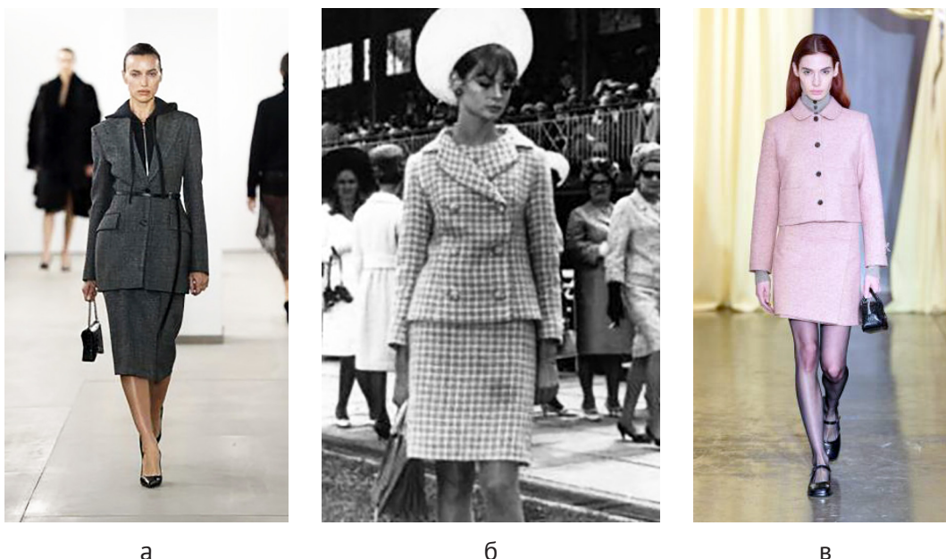
Рисунок 8 – Юбочный костюм: а – коллекция готовой одежды Michael Kors, осень 2024 9 ; б – Джин Шримптон в Мельбурне, 1965 6 ; в – женский костюм Chanel 10