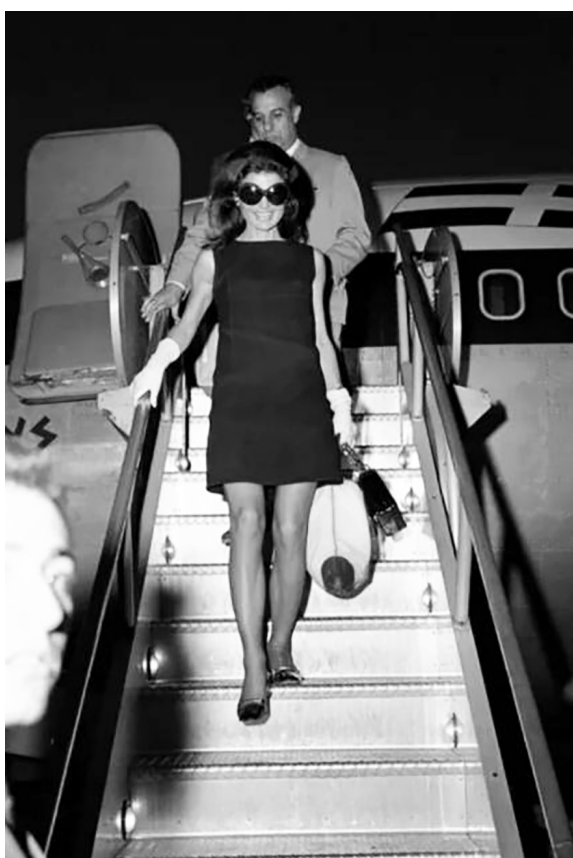
Рисунок 4 – Жаклин Кеннеди в платье-шифт от Lily Pulitzer 4

Эти яркие фигуры были символом «свингующих» шестидесятых. Несмотря на текущие тренды, такие как возрождение бохо 1970-х и продолжение минимализма 1990-х, именно 1960-е годы остаются главным источником вдохновения для современных