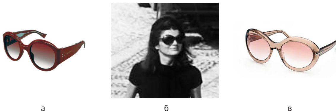
Рисунок 7 – Большие солнцезащитные очки: а – солнцезащитные очки Gucci 7 ; б – Жаклин Кеннеди 6 ; в – солнцезащитные очки Tom Ford 8