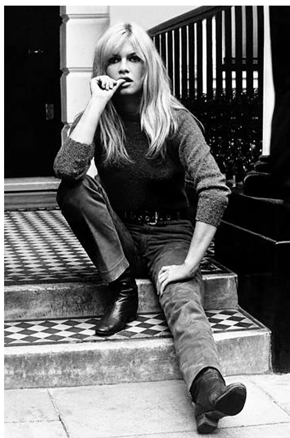
Рисунок 5 – Бриджит Бардо 5