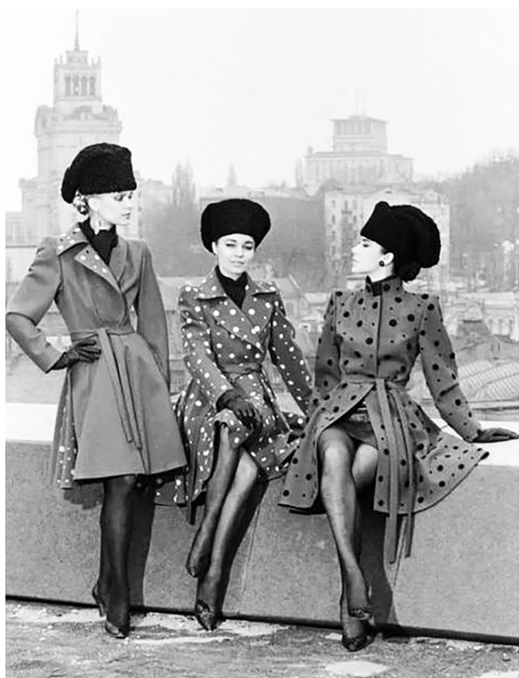
Рисунок 1 – Мода 1961 года 1