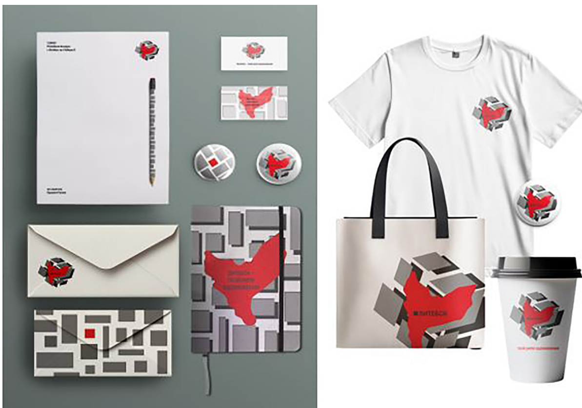
Рисунок 4 – Полиграфическая и сувенирная продукция с использованием разработанного логотипа

Далее все зарисовки и этюды были преобразованы в полиграфическую сувенирную продукцию (рис. 4).