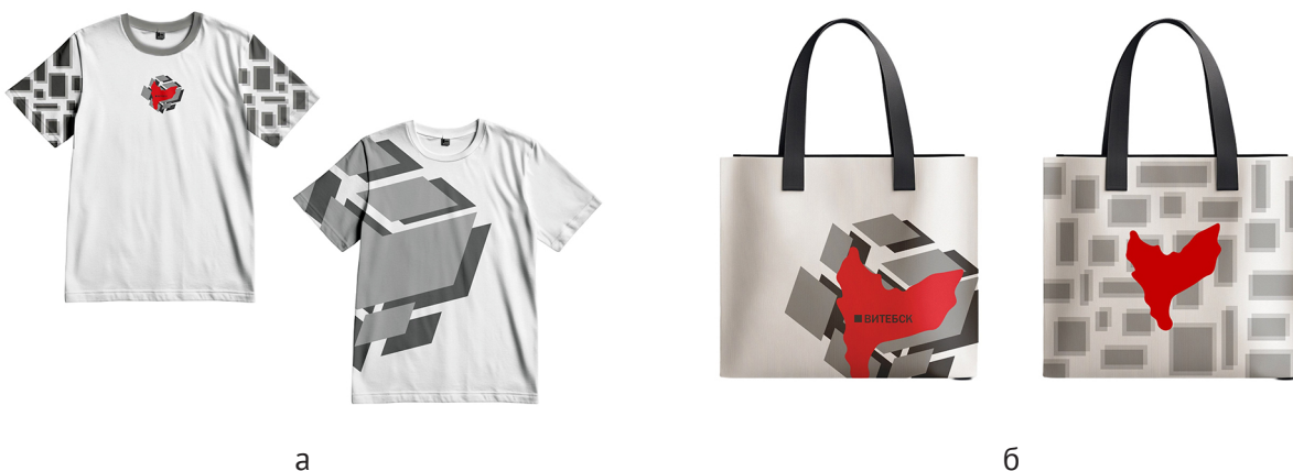
Рисунок 3 – Применение знака города: а – на майках; б – на шоперах

Рукава украшены узором из пересекающихся прямоугольников, повторяющих главный мотив. Симметричная композиция усиливает ощущение баланса и стабильности. Палитра ограничена белым, серым и насыщенным красным, что подчёркивает ключевые акценты.