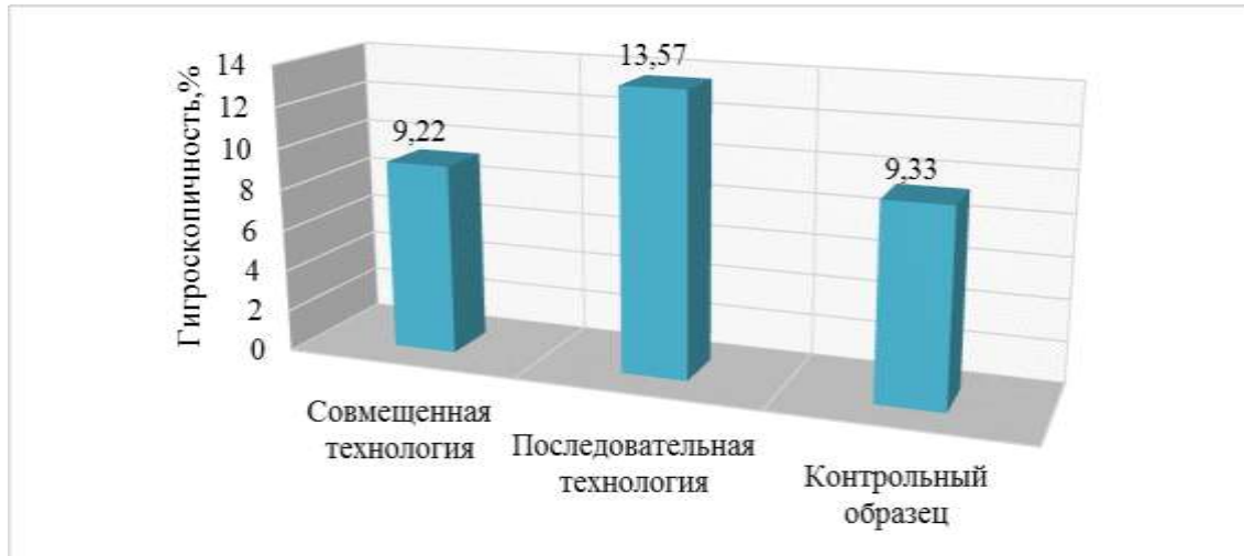
Рисунок 1 – Оценка гигроскопичности образцов после обработки