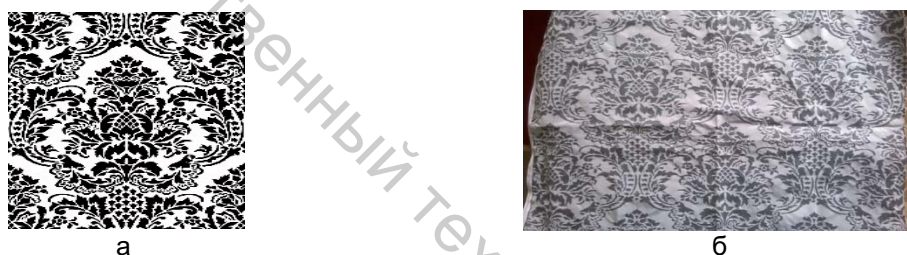
Рисунок 1 – Разработанный ассортимент тканей для настенных покрытий с узором дамаск (а) и наработанный образец (б)

Дамаск украшает интерьер, привносит ему ноты роскоши, любим потребителями всех половозрастных групп, вписывается в любой стиль и помещение [2]. Текстиль – это первый материал, на котором появился дамаск, а в наше время появилось огромное количество искусственных и синтетических материалов, которые воссоздают этот орнамент и при этом очень долговечны, приятны на ощупь, легко стираются и чистятся (рисунок 1) [3].