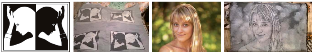
а б в г Рисунок 3 – Разработанный ассортимент тканей для настенных покрытий с антропометрическим рисунком (а, в) и наработанные образцы (б, г)

стилизированный с упрощением и без стилизации с иммитацией карандашной техники. Такие изображения будут допустимы для декоративных вставок на стене (рисунок 3).