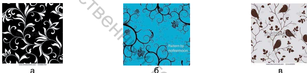
а б в Рисунок 4 – Разработанный ассортимент тканей для настенных покрытий с растительными (а, б) и комбинированными (в) мотивами

Мотивы, используемые на рисунке 4 динамичные, направление движение четко просматривается устремлением элементов снизу-вверх, что обеспечивается особенностью изображаемых стилизованных растений в их росте и стремлении к солнцу. Расположение рисунка идет по диагонали (рисунок 4 а, б) или по вертикали (рисунок 4 в) с делением на поля раппорта на три зрительно равные между собой части.