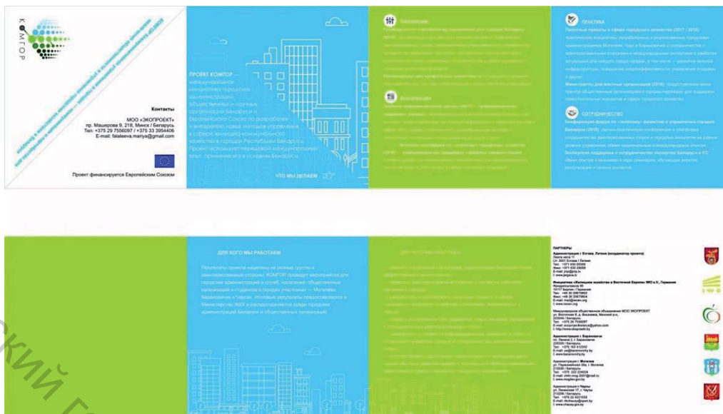
Рисунок 3 – Фирменный буклет

В заключение необходимо еще раз подчеркнуть, что фирменный стиль играет неоценимую роль при создании имиджа проекта. Хороший фирменный стиль привлекает потребителей, предоставляя возможность, фирме или проекту, получения прибыли и позиционирования на рынке.