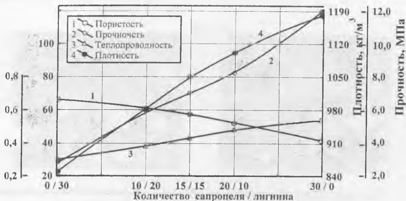
Рисунок 1 - Зависимости свойств легковесов серии лигнин-сапропель от количественного соотношения выгорающих компонентов в комбинации.

Повышение прочности образцов с увеличением доли сапропеля в комбинации, очевидно, связано с процессами кристаллизации расплава, образовавшегося за счет взаимодействия СаО зольного остатка с легкоплавкими железистыми эвтектиками, с формированием алюмосиликатов и силикатов кальция. В фазовом составе обожженных