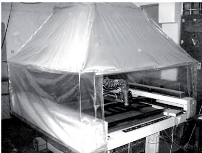
Рисунок 3 – Опытно-промышленная установка лазерного раскроя

В общем виде предлагаемый процесс изготовления объемного объекта методом ТПС состоит из нескольких этапов: формирования компьютерной твердотельной 3D-модели изделия; программного рассечения геометрической модели набором плоскостей и автоматической раскладки сечений; трансляции графической информации о сечениях в сигналы управления раскройной головкой; автоматического расчета технологических параметров в зависимости от вида и толщины исходного материала; установки листа исходного материала на стол установки и автоматического его раскроя; ручной сборки слоев путем склейки и/или механического соединения; отделки поверхности путем механического съема выступов объекта либо заполнения впадин отделочными материалами.