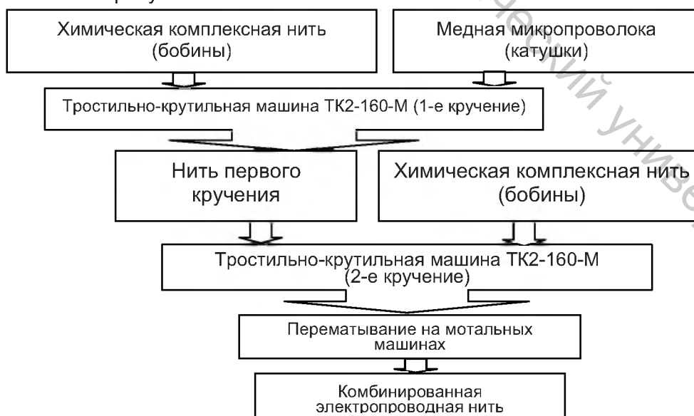
Рисунок 1 - Технологическая цепочка получения комбинированных электропроводящих нитей на тростильно-крутильном оборудовании

На кафедре ПНХВ УО «ВГТУ» разработан способ получения комбинированных электропроводных нитей на тростильно-крутильной машине, схема которого представлена на рисунке 1.