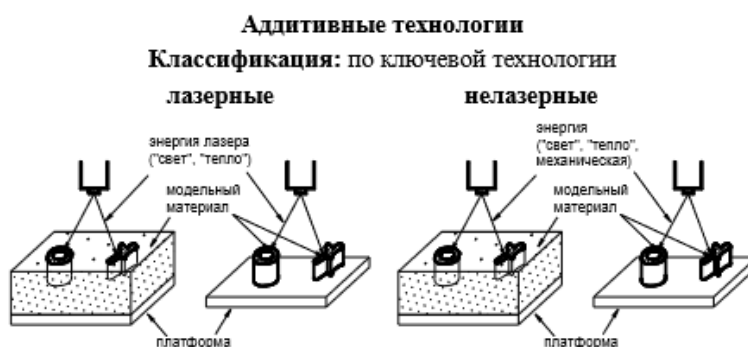
Рисунок 3 – Классификация по ключевой технологии