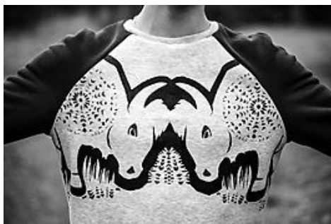
Рисунок 7 – Модель мужского ассортимента. Автор Лаховец В.

мужских моделей одежды. Тема зубра отражает силу и мужественность в структуре декора, а вытинанка придаёт орнаменту лирические нотки.