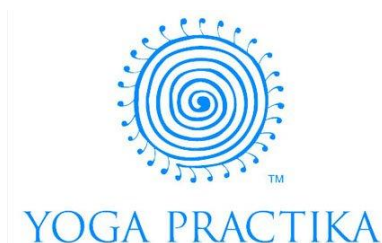
2017, YOGA PRACTIKATM