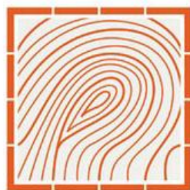
2013, Bracken Leadership