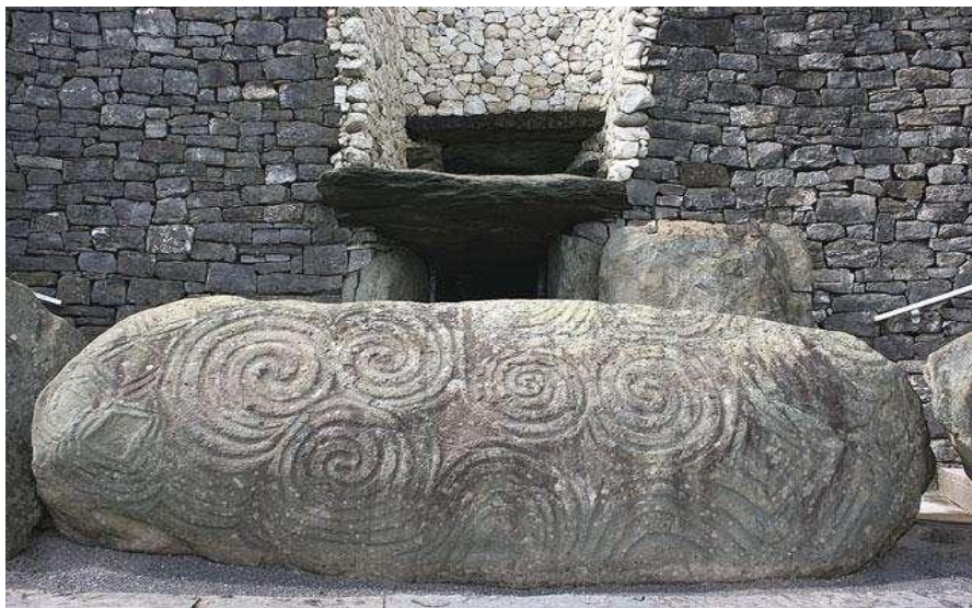
Рисунок 1 – Камень со спиральным орнаментом, Нью-Гейндж, Ирландия, 3 тыс. до н.э. [ http://secrets-world.com/history/7682-igry-s-razumom.html ]

В данной статье из множества символов выбран один: спираль. Простая двумерная спираль – это один из древнейших символов, она означает цикличное возвращение к началу, разворачивание жизни: цикл за циклом (цикличность). Пространственную спираль можно представить себе как смерч – виток за витком параллельно вертикальной оси. В древних культурах круги и спирали несли в себе магический смысл: они встречаются в резьбе на каменных плитах, в росписи керамики. Так как спираль является символом жизни и смерти, а также возрождения души, этот символ часто встречается на плитах в гробницах (рис. 1).