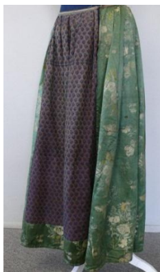
Юбка. Кан. XVIII - пач. XIX ст. Атлас. Бавоўна.

Спадніцы комплексу мяшчанскага касцюма у складку, доўгія, са устаўкамі наперадзе з лёну або бавоўны, былі пашыты з шоўку, атласу – мануфактурных тканін, ўпрыгожаных суквеццамі, матылямі, дрэўцамі і квітнеючымі травамі (КП 1236/а, 1237/а)