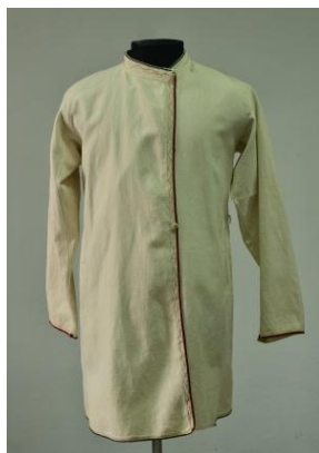
Насоў. Канец XIX–пач. XX ст. Бавоўна

Сарочки-касавароткі з разрэзам каўнера па левым баку з'явіліся ў рускага народа у XIV–XV стагоддзі, выцесніўшы крой тунікаабразных кашуль усходніх славян з прамым разрэзам каўнера [3]. Артэфакты з музея, насавы двух тыпаў, маюць характарыстыкі, якія практычна супадаюць з апісаннямі Н.Нікіфароўскага. [16, стр. 109, 110]. Адзін з насоваў з бавоўны кафтаннага крою, упрыгожаны фабрычнай тасьмой.