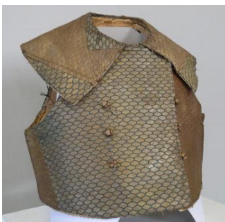
Камізэлька. Кан. XVIII – пач. XIX ст. Парча. Палатно

Аб вопратцы габрэйскіх жанчын губерні існуюць наступныя пасведчанні: «Женщины-еврейки разумеется, достаточные, одеваются в кунтуши, юбки и корсеты разноцветные: люстриновые, атласные, гранитуровые и ситцовые. Нагрудники дорогой битой парчи <...> галуном обшитые». Да збору музея належаць і «нажутка-безрукаўка з слуцкай тканіны XVIII стагоддзя» [6] (КП 945).