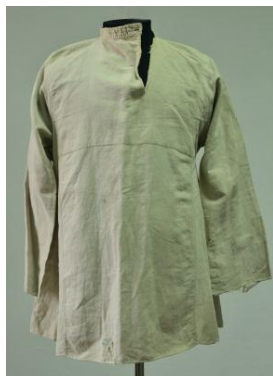
Сарочка-касаваротка. XIX ст. Палатно

прамым разрэзам на грудзях, ільняная сарочка-касаваротка (КП 1231/2, 1232/2).