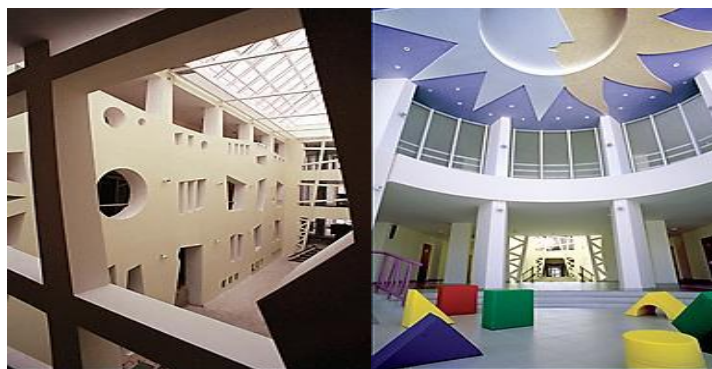
Рисунок 2 – Интерьеры Московского коррекционного центра

Регулирование формы коридоров может быть проиллюстрировано. Есть места, вроде уширения коридора, где можно посидеть у окна, и там сами собой создаются условия, приглашающие к общению. Интерьеры помещений направляют детей, создают предсказуемую спокойную последовательность обстановки, «чистую», лишенную нагромождений, атмосферу; и климат-комфорт. Так, желательно отсутствие длинных коридоров, помещения должны перетекать из одного в другое, не образуя на пути излишних препятствий.