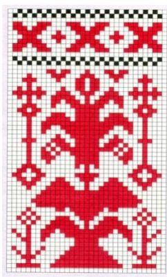
Рисунок 5 – Дерево жизни

– Дерево жизни – это модель мира всех древних народов. В древности оно считалось источником жизни и плодородия, мудрости и бессмертия (рис. 5).