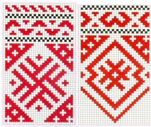
Рисунок 2 – Символ солнца

Лента оберег – символическое изображение солнца (рис. 2).