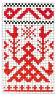
Рисунок 4 – Женский силуэт

– Дерево жизни – это модель мира всех древних народов. В древности оно считалось источником жизни и плодородия, мудрости и бессмертия (рис. 5).