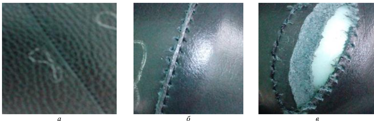
Рисунок 3 – Внешний вид однорядного настрочного шва при сострачивании образцов (игла KKS, шов без упрочнения):

a – высота подъема пуансона 20 мм; б – высота подъема пуансона 30 мм; в – высота подъема пуансона 40 мм