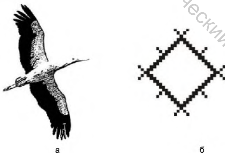
Рисунок 1 – изобразительный (а), орнаментальный (б) мотивы, используемые в комплекте

Анализ современных штучных изделий из льна (рушники, полотенца, декоративные покрывала, скатерти) показал, что дизайнеры при разработке рисунков как правило обращаются к белорусскому народному орнаменту и предметам быта. В орнаментальных композициях отсутствуют изображения животного и растительного мира в сочетании с традиционными белорусскими символами. Поэтому при разработке столового комплекта в основу композиции положено совмещение изобразительного мотива в виде белорусского «бусла» и орнаментального мотива «Солнце» (рисунок 1).