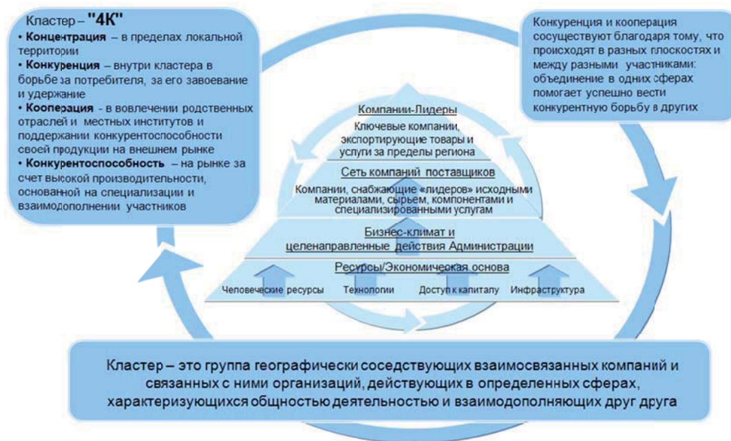
Рисунок 1 – Характеристика кластера

В экономическую литературу понятие "кластер" было введено в 1990 году американским ученым М. Портером, согласно которому кластер - это сконцентрированные по географическому признаку группы взаимосвязанных компаний, специализированных поставщиков, поставщиков услуг, фирм в соответствующих отраслях, а также связанных с их деятельностью организаций (например, университетов, агентств по стандартизации, а также торговых объединений) в определенных областях, конкурирующих, но вместе с тем ведущих совместную работу [8]. Более подробно о кластере представлена информация на рисунке 1.