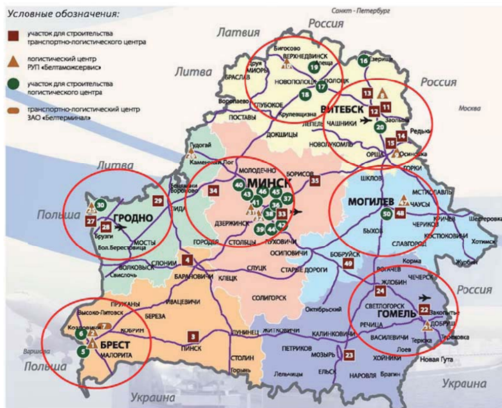
Рисунок 2 – Схема размещения логистических центров в Республике Беларусь

Вышеназванные кластеры относятся к сфере производства товаров. Хотелось бы отметить, что данная сфера является наиболее актуальной для Республики Беларусь, а создание фармацевтического кластера и кластера по производству льнопродукции позволит получить значительную прибыль. Однако не стоит забывать о возможности создания кластеров и в сфере услуг. Конечно, в сфере услуг уже созданы транспортно-логистические центры - логистические центры, предназначенные для оказания комплекса транспортно-экспедиционных услуг при перевозке грузов, а также сопутствующих услуг участникам транспортно-логистической деятельности. Согласно утвержденной Программе развития логистической системы Республики Беларусь до 2015 года, на территории республики к концу 2015 года должны начать свою работу 50 логистических центров [6]. С учетом изменений и дополнений, внесенных в программу Постановлением Совета Министров Республики Беларусь от 2 сентября 2011 г. № 1179, количество участков для строительства и размещения логистических центров сокращено до 39 (рисунок 2). Согласно официальным данным Министерства транспорта и коммуникаций Республики Беларусь, на 01 января 2013 г. в Республике Беларусь был открыт 21 логистический центр различной функциональности, а в 2014 году открыто еще 9 центров [6]. Данное направление также является одним из приоритетных для экономики Беларуси.