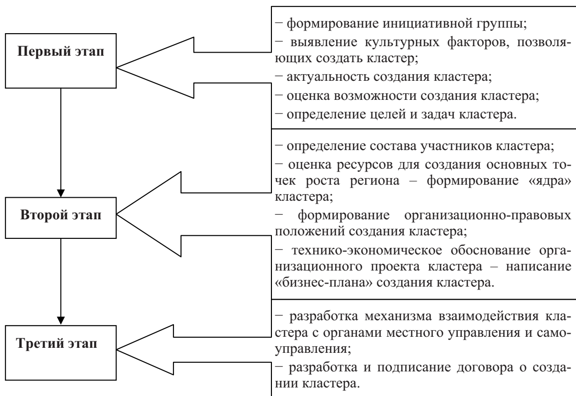
Рисунок 3 – Схема разработки культурного кластера

Так, этапы создания культурных кластеров в Республике Беларусь можно отразить на схеме (рисунок 3).