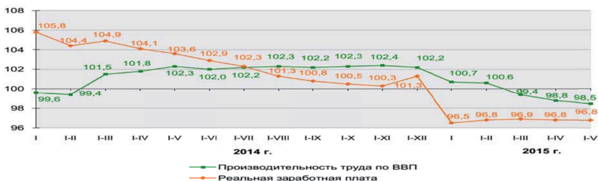
Рисунок 3 – Производительность труда по ВВП и реальная заработная плата (в % к соответствующему периоду предыдущего года)

В январе-мае 2015 г. темп производительности труда по ВВП в Республике Беларусь составил в сопоставимых ценах к уровню января-мая прошлого года 98,5%, опередив темп реальной заработной платы (96,8%) [1]. Динамика показана на рис. 3.