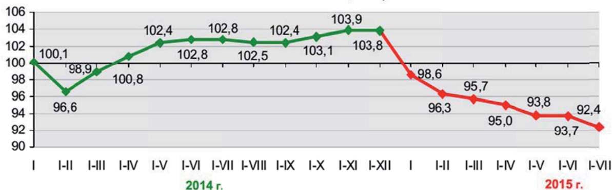
Рисунок 2 – Производство валового регионального продукта Витебская область (в % к соответствующему периоду предыдущего года; в сопоставимых ценах)

Осуществлена оценка валового регионального продукта (Витебская область) за январь-июль 2015г. Объем ВРП в январе-июле 2015 г. в текущих ценах сложился в сумме 37,7 трлн. рублей. Темп ВРП за январь-июль 2015 г. в сопоставимых ценах составил 92,4% (при прогнозе на 2015 год в соответствии с постановлением Совета Министров Республики Беларусь от 24 декабря 2014 г. № 1238 – 100,5-100,9%). Валовой региональный продукт (ВРП) является региональным аналогом статистического показателя валового внутреннего продукта по Республике Беларусь, рассчитанного производственным методом. ВРП – обобщающий показатель экономической деятельности региона.