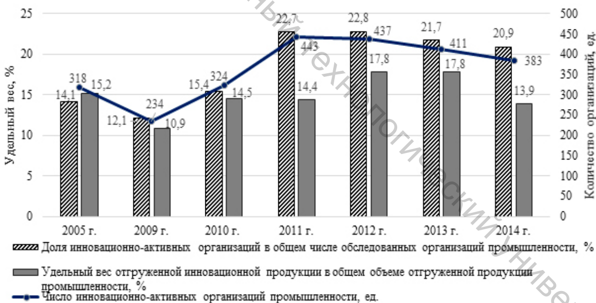
Рисунок 2 – Показатели инновационной активности экономики Республики Беларусь за 2005–2014 гг.

Источник: составлено по данным [7, с. 56; 8, с. 76].