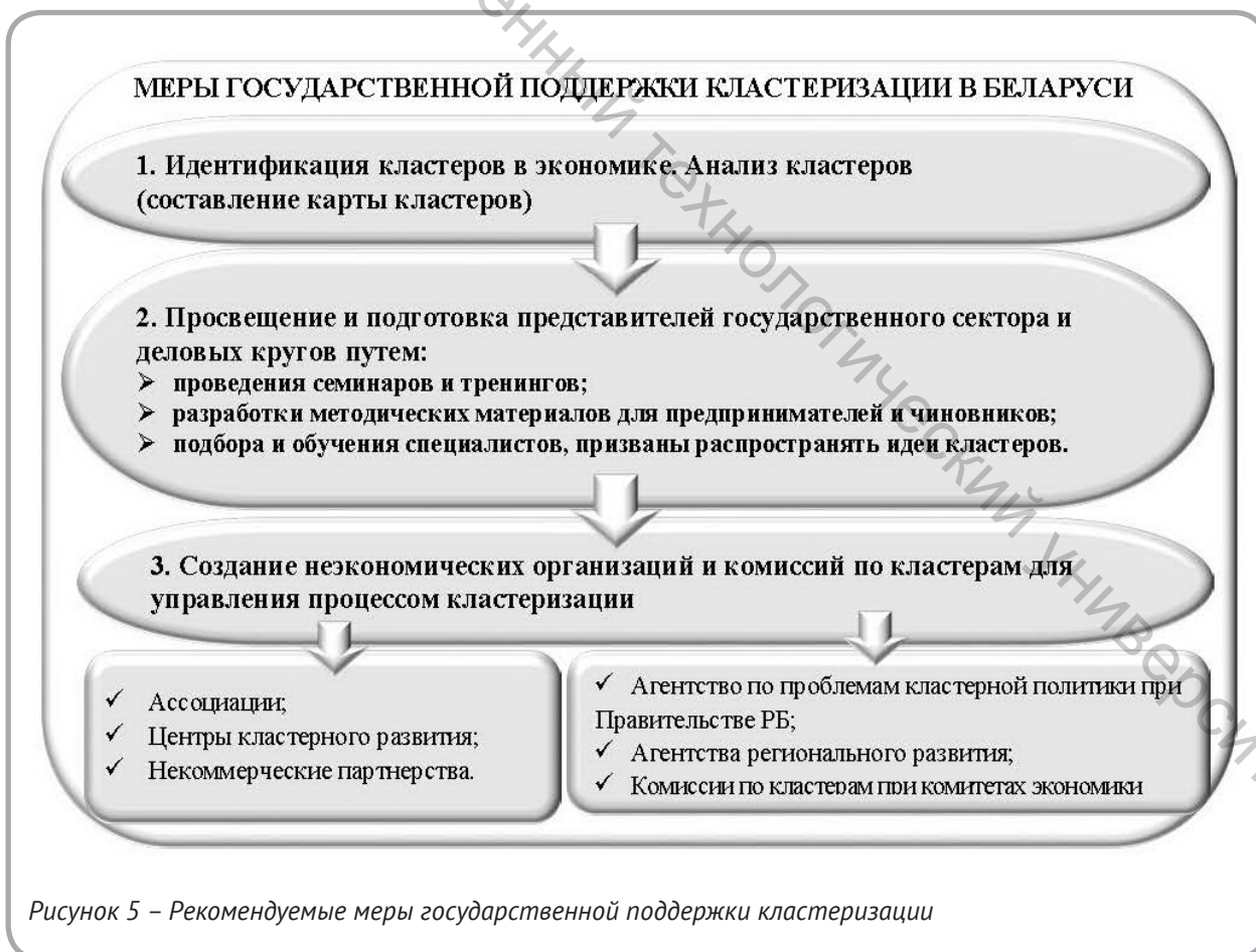
Рисунок 5 – Рекомендуемые меры государственной поддержки кластеризации

В соответствии с эмпирическими заключениями М. Портера по формированию кластерной