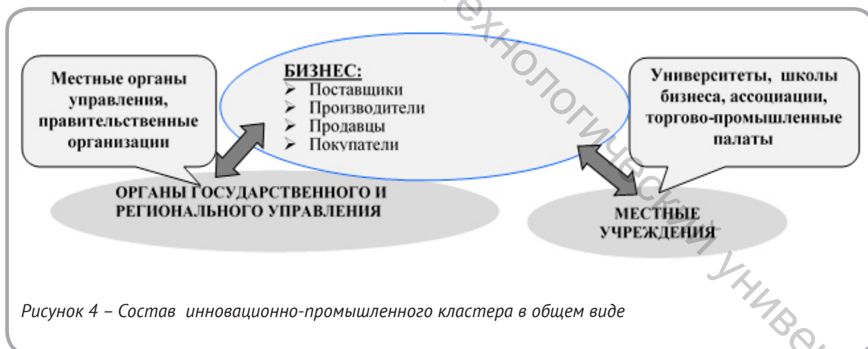
Рисунок 4 – Состав инновационно-промышленного кластера в общем виде

В отличие от традиционных промышленных кластеров, инновационно-промышленные кластеры представляют собой систему тесных взаимосвязей не только между фирмами, их поставщиками и клиентами, но и институтами знаний, среди которых крупные исследовательские центры и университеты, являясь генераторами но-