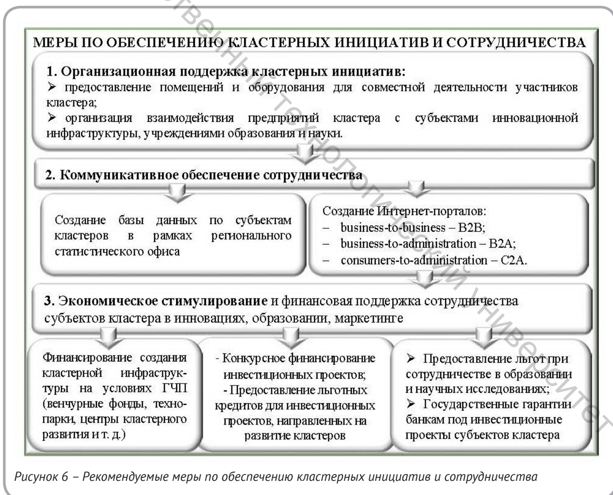
Рисунок 6 – Рекомендуемые меры по обеспечению кластерных инициатив и сотрудничества

Значительная роль в кластеризации зарубежных экономик принадлежит промышленным ассоциациям. Они выступают инициаторами создания кластеров в регионе, оказывают помощь в разработке национальной/региональной стратегии конкурентоспособности посредством предоставления информации об уровне конкуренции, требованиях покупателей, новых рыноч-