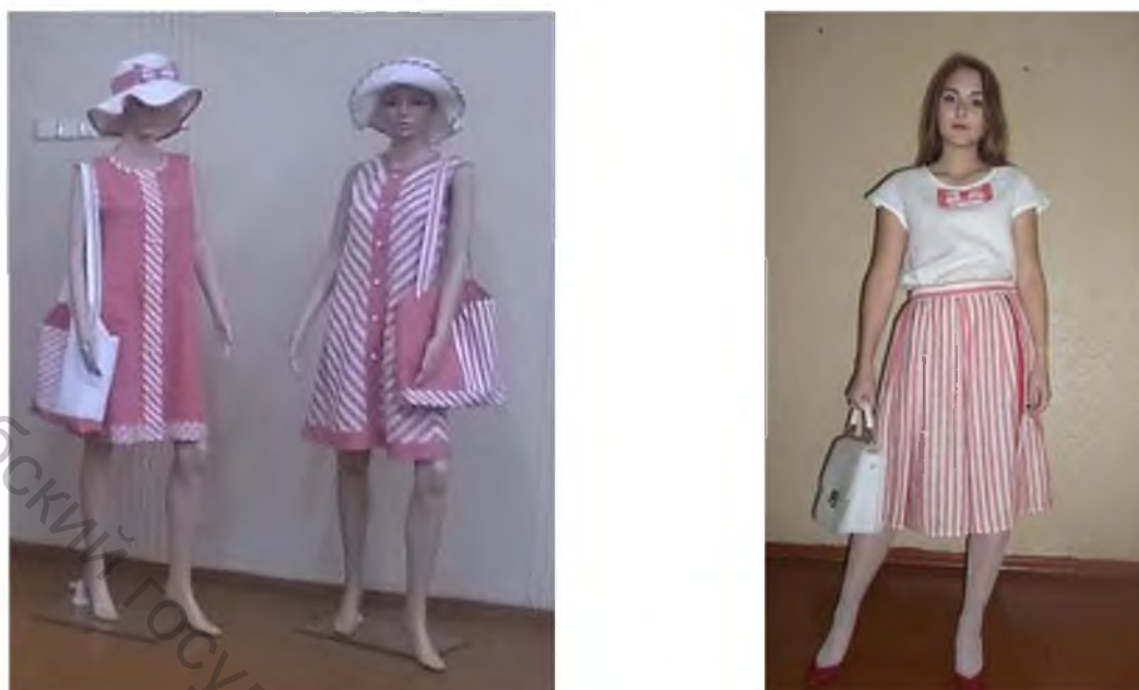
Рисунок 2 – Коллекция «Крузиз»

Представленные модели (рисунок 3) современные, целесообразны и выразительны. Модели предназначены для повседневного использования. Уникальные свойства льняных тканей делают изделия из них востребованными, популярными и модными на современном рынке как в Беларуси, так и за рубежом.