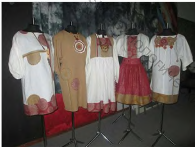
Рисунок 1 – Коллекция молодежной одежды «Folk-Street»

Так, авторская коллекция молодежной одежды «Folk-Street» (рисунок 1) разработана с учетом последних тенденций моды, элементов народного белорусского костюма из тканей РУИПП «Оршанский льнокомбинат».