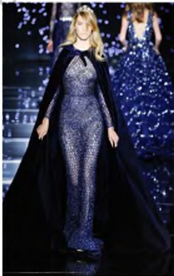
Рисунок 1 – Zuhair Murad Couture, осень-зима 2015/16

Интересными стали и модели весенне-летней коллекции Gary Graham (Рис. 3). Его образы предстают в таинственном, сказочном, природном свете, причудливо переплетаясь с другими стилями.