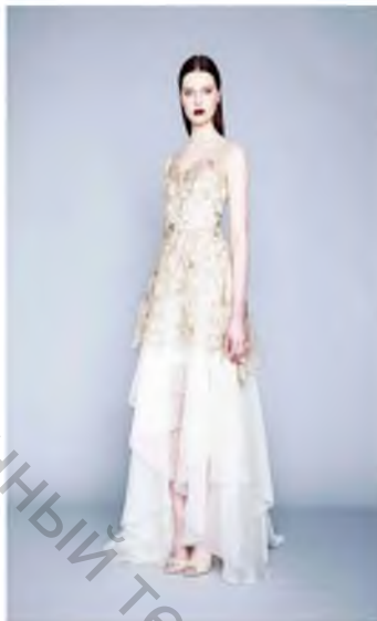
Рисунок 2 – Marchesa Notte Ready-to-wear, осень-зима 2015/16