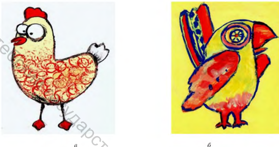
Рисунок 5 – Персонаж для рекламы а) женского клуба, б) студии детского творчества

С точки зрения теории восприятия дерева, представленные на рисунке 4, транслируют следующие характеристики: а) женское начало, уверенность, аккуратность, контактность, позитивность, любопытство, хороший интеллект, настойчивость, простота, т.е. в целом очень положительный образ, за исключением участков зачернения, которые свидетельствуют о некоторой тревожности; б) женское начало, импульсивная решительность, устойчивость, находчивость, позитивность, внимание к мелочам, интерес к реальным событиям, здравомыслие, неординарность; к отрицательным чертам можно отнести скрытность (скрытые ветви).