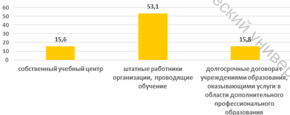
Рисунок 2 – Распределение мнений респондентов о наличии условий и базы для организации внутрифирменного обучения, %

Для респондентов значимым представляется условие наличия договоров с центрами и организациями, предоставляющими услуги дополнительного профессионального образования. Незначимыми оказались условия, связанные с формальными и неформальными отношениями по поводу организации обучения с учреждениями профессионального, специального и высшего