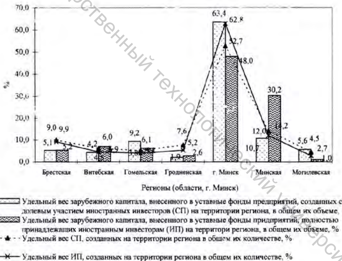
Рисунок 1 – Структура распределения зарубежного капитала предприятий с иностранными инвестициями и их количества в региональном разрезе

Участниками создания на территории Республики Беларусь предприятий с иностранными инвестициями в настоящее время являются 4218 иностранных партнеров, из которых 2321 инвестор принял долевое участие в создании совместных предприятий и 1897 - полностью сформировало уставные фонды иностранных предприятий.