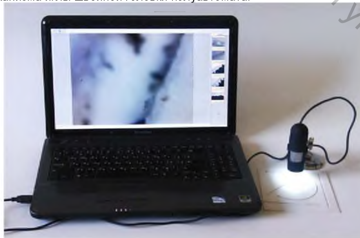
Рисунок 2 – Измерительная установка

В результате проведенных исследований получены зависимости величины неровности поверхности контуров, полученных при пробивании листа ПВХ пробойником с конической режущей частью, от окружной скорости кривошипа механизма иглы швейной головки полуавтомата.