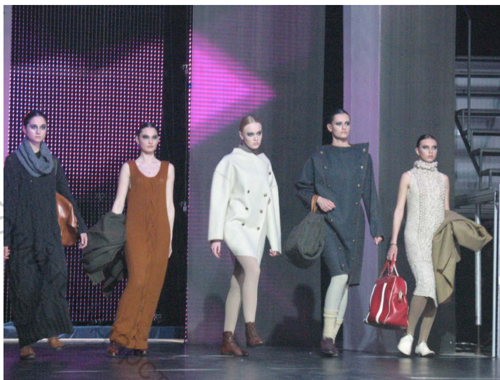
Рисунок 2 – Дипломная коллекция под девизом «Шинель № 5», Автор Тур Т.В.