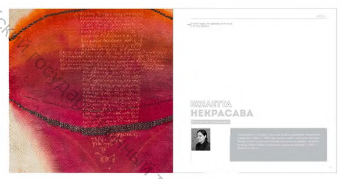
Рисунок 2 — Разворот презентационного альбома

Стилистика презентационного альбома связана с гармонией, строгими пропорциями, четкими формами, симметрией. Использование классических законов типографики и современных типографских приемов в верстке альбома, создают впечатление строгости и лаконичности и вместе с тем современности и элегантности. В проекте использовалась эстетика конструктивизма и симпатия к прямым линиям: линейки, прямоугольные формы, подчеркивания и т.д. Типографские элементы оживляют пространство, внося необходимые мелкие формы. Применение двух разных шрифтов разных цветов задает целостность и простоту. Основное цветовое решение альбома — монохромная гамма с преобладанием различных оттенков серого цвета для текстовых блоков, а также использован красный цвет для придания контрастности изданию. В качестве основы для размещения текстовых блоков была разработана схема размещения текста на каждом развороте. Для каждого художника разработаны два разворота, на первом развороте с правой стороны размещается фрагмент работы с версткой на вылет, с левой стороны размещается основная биографическая информация и фото автора (рисунок 2).