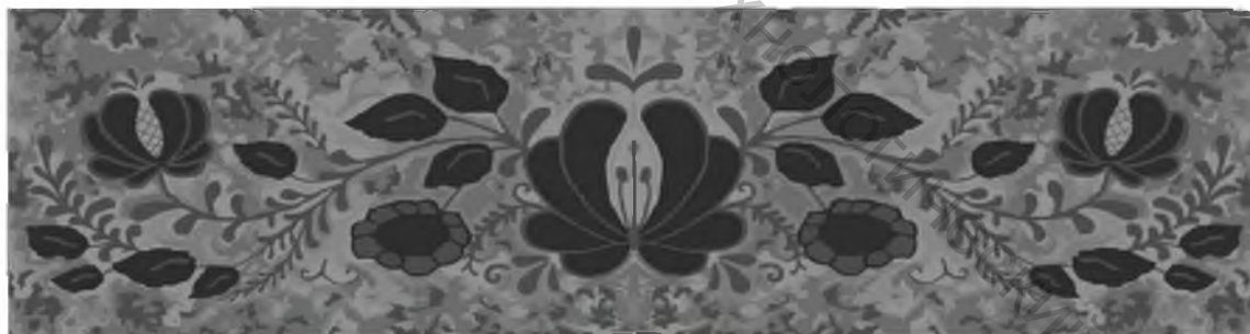
Рисунок 2 – Мотив узора тканого скатертного полотна

Органично дополнили композицию ветви продолговатой формы, характерные для барбариса (рисунок 1, г), который славится целебной силой и благоприятно влияет на атмосферу жилого интерьера. Соединяющим компонентом цветков и листьев стала оливковая ветвь – символ мира и согласия в доме (рисунок 1, д). В качестве фона для усиления эмоционального образа ткани в целом, сочетания таких разных элементов, как индийский лотос, кувшинка, подсолнух, листья барбариса, оливковая ветвь в единое целое предложено использовать мраморный эффект – символ долговечности и несокрушимости, целостности семьи (рисунок 1, е). Мотив узора представлен на рисунке 2, эскиз применения – на рисунке 3.