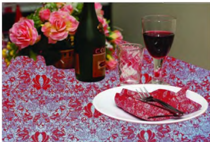
Рисунок 3 – Эскиз применения