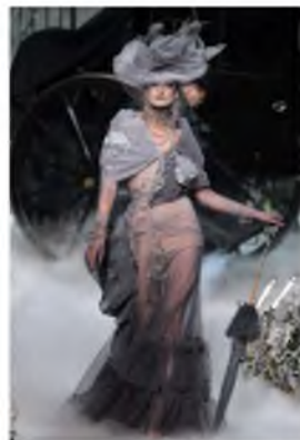
Рисунок 4 – Dior 2005/06 Couture