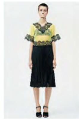
Рисунок 6 – Christopher Kane Resort 2015

На данном этапе модная индустрия, начиная от разработки самой идеи коллекции и заканчивая ее выполнением в материале и презентацией, – впадает в кризис: изменение предпочтений потребителей, даже привилегированного круга, в сторону комфорта и упрощения вынуждает дизайнеров искать новые пути решения поставленной задачи [6]. Складывается впечатление, что, перебирая известные концепции и пытаясь создать новые идеи для будущих коллекций, модельеры впадают в крайности, вынося на подиум и в массы логотипы «Макдональдс» (Рис. 5) [7], включая в коллекции вещи кислотных цветов с кружевом (Рис. 6) и прочие весьма сомнительные идеи, которые безоговорочно и с радостью принимаются публикой [8]. Можно только предполагать, к чему приведет модную индустрию такая политика, когда дизайнеры периодически забывают о возложенной на них задаче создавать гармоничные модели и прививать хороший вкус обществу, а социум становится все менее разборчивым в отношении одежды, которая несет в себе гораздо больше функций, нежели только утилитарную.