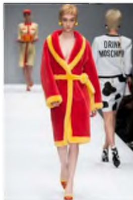
Рисунок 5 – MOSCHINO 2014/15