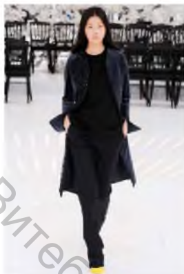
Рисунок 3 – Dior Fall 2014 Couture