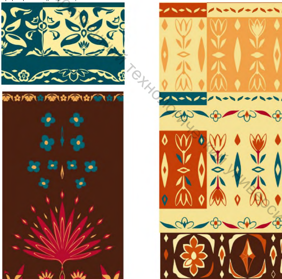
Рисунок 2 – Фрагменты рисунков шарфов

Что касается мотивов, заполняющих плоскости: некоторые из них взяты как есть из поясов, некоторые – трансформированы (рисунок 2).