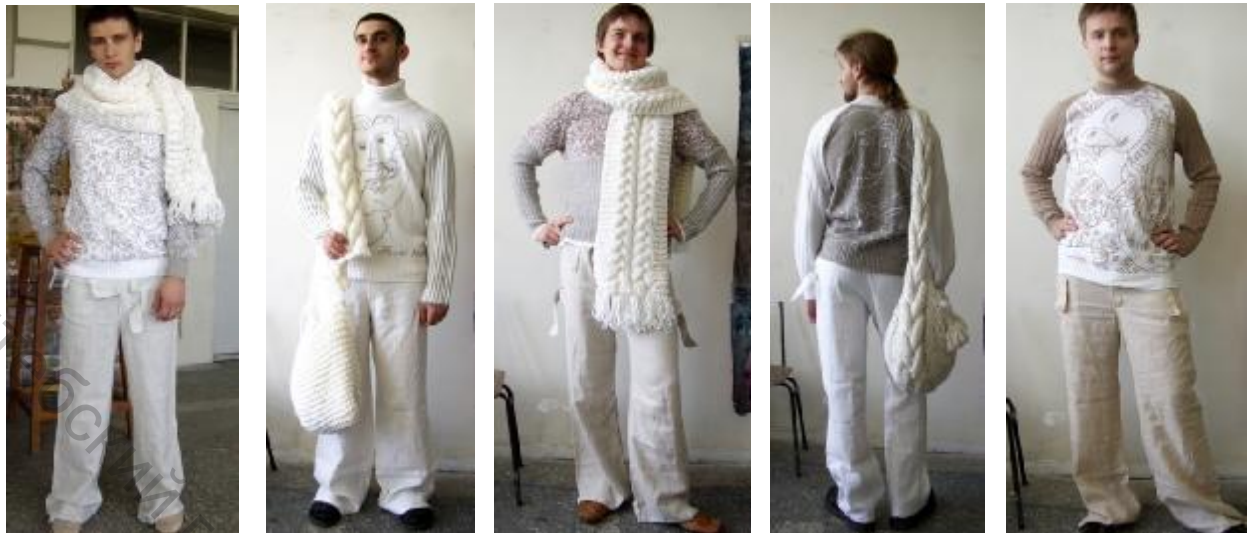
Рисунок 2 - Коллекция мужских моделей по мотивам графики Анри Матисса

Использование мотивов графики при проектировании мужских трикотажных комплектов является современной и яркой идеей. Коллекция выполнена в материале на трикотажном предприятии «Полесье» г. Пинск. Коллекция моделей мужской одежды является актуальной, соответствует тенденциям моды. Комплекты могут выпускаться на промышленных предприятиях, способны составить конкуренцию аналогичной группе изделий, как на внешнем, так и на внутреннем рынках.