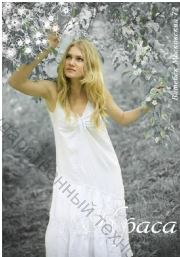
Рисунок 5 – Плакат для льняной одежды ЭОП УО «ВГТУ»

Цветок льна, используемый в плакате, представляет собой векторный графический рисунок. Данный рисунок был разработан путём стилизации и последующей прорисовки цветков льна.