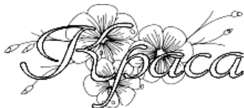
Рисунок 1 – Логотип

Изобразительный знак «Краса» имеет выразительное стилистическое и пластическое решение, наиболее полно соответствует имиджу коллекции. В комбинированном знаке использовано сочетание простых линий и сложной графики цветка льна, что подчеркивает не только его удобочитаемость, но и декоративность. Основная задача при создании – как можно более точно указать потребителю сообщения на некоторый объект и его свойства и пробудить в нем потребность в определенных действиях, направленных на этот объект (рисунок 1).