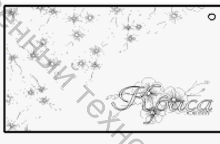
Рисунок 3 – Этикетка женской льняной одежды ЭОП УО «ВГТУ»

Разработанная этикетка (рисунок 3) выполнена грамотно. Является современной и не выпадает из «контекста» разработанного фирменного стиля.