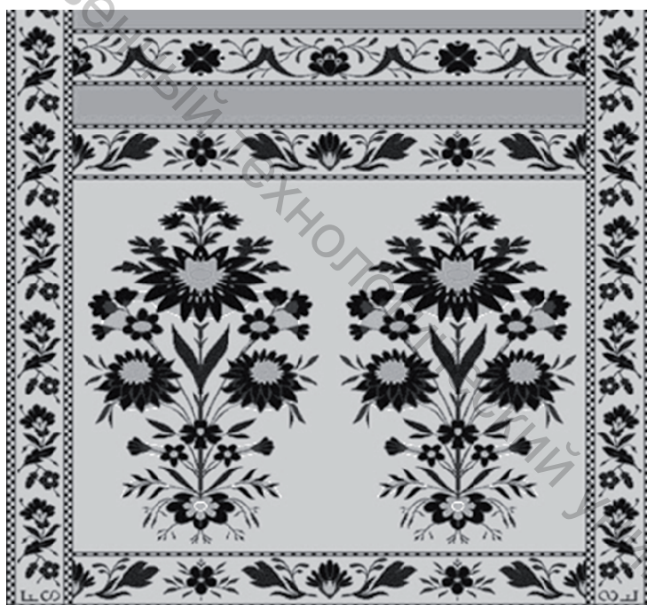
Рисунок 2 – Исторический пояс – мотив

Элементы головы должны симметрично повториться два раза. На базе выбранной стилистики и с учетом технологических возможностей разработаны следующие элементы для головы пояса.