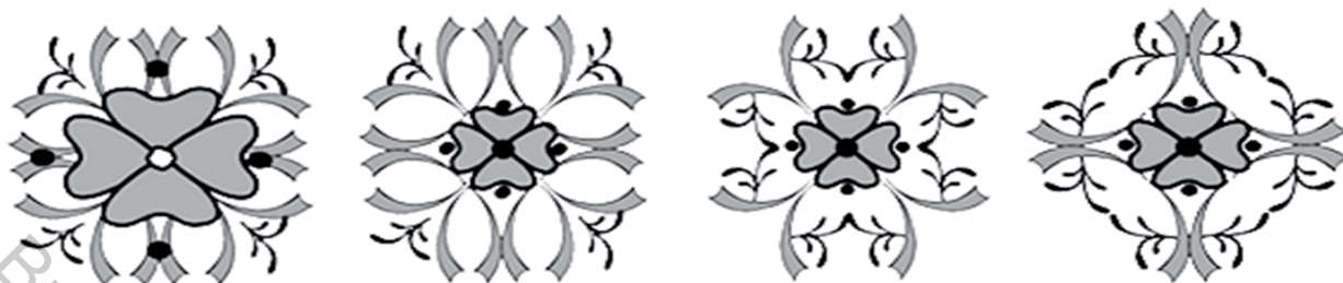
Рисунок 4 – Узоры для головы пояса

Так же как и в историческом поясе в эскизе сувенирной продукции присутствуют метки в виде латинских букв FS. Нарботанный материал позволил создать эскиз сувенирной продукции – закладка для книги по мотивам слуцких поясов, являющихся брендом Беларуси.