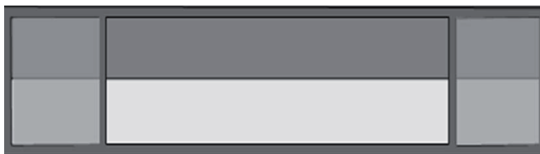
Рисунок 1 – Композиционная схема

Классический слуцкий пояс – это роскошная длинная (до 350 – 400 мм) ткань шириной 35 – 40 см, которую, складывая вдвое или скручивая, повязывали поверх шляхетского костюма (кунтуша). Аксессуар мог быть одно-, двух-, трех-, четырехлицевым. Каждая из сторон использовалась в зависимости от колорита наряда и ситуации. По композиции слуцкий пояс разделен на три части: два прямоугольных завершения – «головы» и основная часть – «середник» (рис.1).