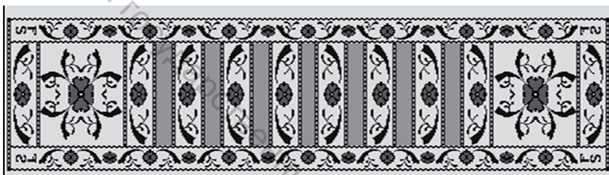
Рисунок 5 – Технический рисунок для сувенирной продукции

Так же как и в историческом поясе в эскизе сувенирной продукции присутствуют метки в виде латинских букв FS. Нарботанный материал позволил создать эскиз сувенирной продукции – закладка для книги по мотивам слуцких поясов, являющихся брендом Беларуси.