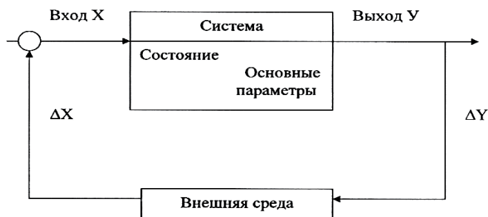
Рисунок 1 – Кибернетическая модель логистической системы

На основе анализа процесса регулирования в экономике и его модели в форме схемы контура управления с обратной связью, можно изобразить кибернетическую модель логистической системы и общий вид связей в форме контура управления с обратной связью (рисунок 1).