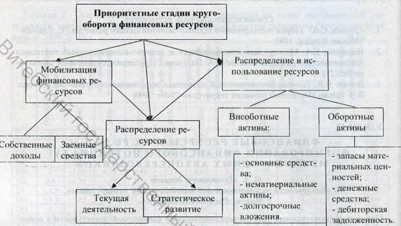
Рисунок 1 – Стадии кругооборота финансовых ресурсов.

– строгой регламентацией объема и порядка исчисления уровня расходов, осуществляемых в иностранной валюте.