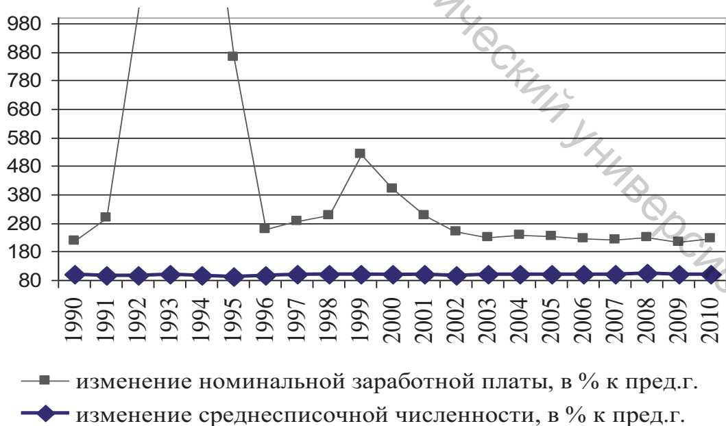
Рисунок 1 – Динамика номинальной заработной платы и численности занятых в Беларуси

Развитие глобальной экономики, усиление значимости человеческого капитала и нематериальных факторов в формировании конкурентных преимуществ организаций и стран, а также значительные сдвиги в социально-демографической структуре общества требуют повышения гибкости рынка труда. Гибкость рынка труда означает возможность адаптации его основных элементов (спроса, предложения и цены труда) к меняющимся условиям, скорость и затраты на адаптацию. Как на макро-, так и на микро-уровне с позиций занятости, «гибкий рынок труда не создает препятствий предприятиям в подстройке размера, состава и затрат на рабочую силу» [4, стр. 1]. Традиционно гибкость рынка труда оценивается по эластичности численности занятых и заработной платы. В этой связи рынок труда Республики Беларусь большинством экспертов оценивается как жесткий [1]. Как показывают данные (рисунок 1), для рынка труда Республики Беларусь в долгосрочном периоде (1990-2010 г.г.) характерна значительная вариация номинальной заработной платы. «Если номинальная заработная плата быстро реагирует на уровень цен, то это свидетельствует о ее жесткости» [5, р. 15].