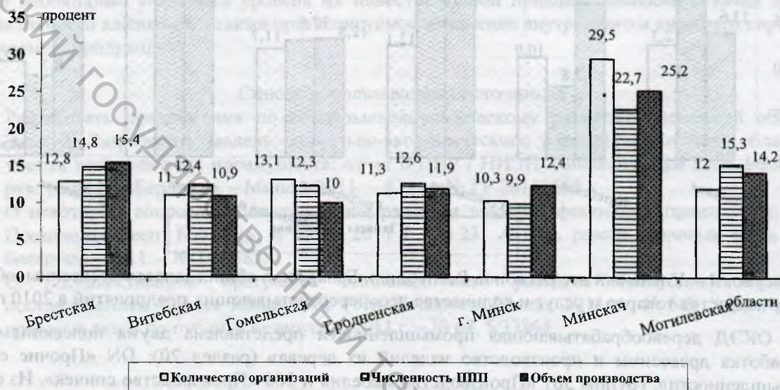
Рисунок 2 – Основные показатели регионального развития подсекции DD «Обработка древесины и производство изделий из дерева» в 2011 г., (в % к итогу по республике)

Основные показатели регионального развития подсекции DD «Обработка древесины и производство изделий из дерева» в 2011 г. представлены на рисунке 2.