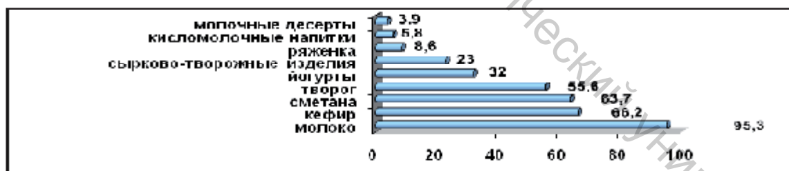
Рисунок 1 — Предпочтения потребителей молочной продукции Беларуси

До недавнего времени набор продуктов в корзине рядового покупателя выглядел достаточно стандартно: пакет молока или кефира, банка сметаны, кусок сыра. Сейчас ситуация в корне изменилась. Белорусские производители вывели на рынок собственные товары, которые смогли не только занять достойное место рядом с раскрученными марками, но и стать доступными для всех слоев населения. Сегодня наблюдается практически полное господство продукции отечественного производства. По определенным позициям наши производители не просто сравнялись с иностранными, но и смогли даже превзойти их.