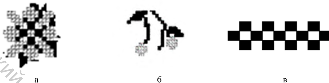
Рисунок 1 – Варианты орнамента: виды стилизации василька: цветки (а), бутоны (б) и кайма (в)

ных мотивов, размещаемых в кайме (рисунок 1в). Эти фигуры – знаки предков. Квадрат определяет четырёхчастность любых структур и процессов, мистический союз четырёх стихий, служит формообразующим элементом зданий и сооружений и определяет совершенство, статичную безупречность, порядок и равенство. В результате дизайн имеет подчеркнутое прямолинейное и непрерывное пластическое движение, направленное по длине ленты. Мотив симметричен, позволяет уравновесить рисунок и фон тканой ленты, удачно завершает композицию, не отвлекая внимание от основного мотива.