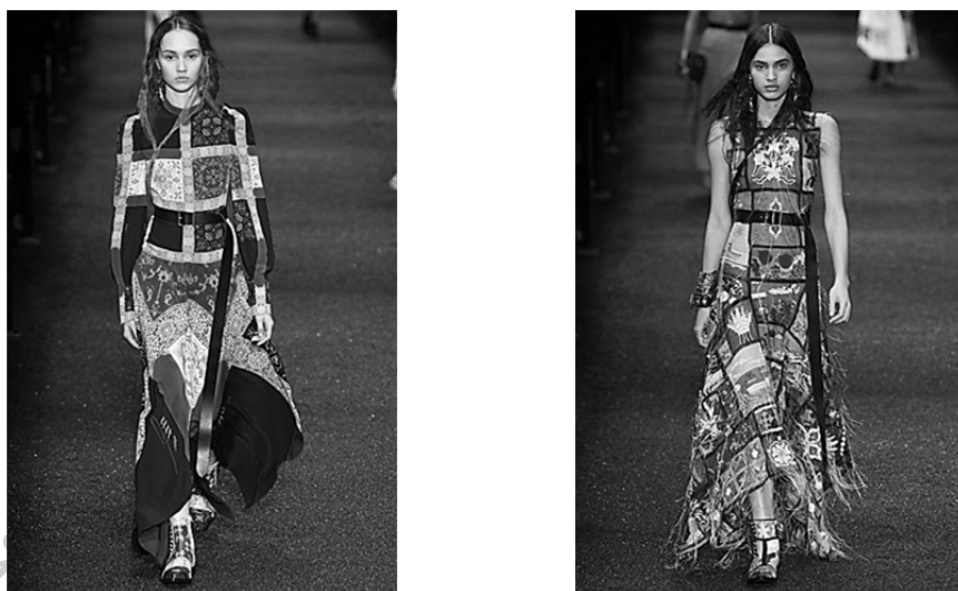
Рисунок 1 – Модели с применением техники «квилтинг» коллекции AleksandMcQueen сезона осень-зима 2017

При проектировании конкурентоспособных пледов также использован прием лоскутного шитья. Техника "квилтинг" выступила как своеобразный творческий источник для разработки композиции будущих образцов.