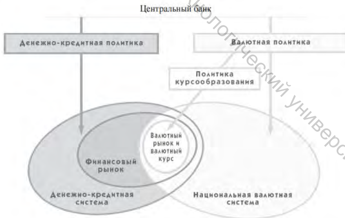
Рисунок 9.1 – Сферы регулирования денежно-кредитной, валютной политики и политики курсообразования

Задание 2. Проанализируйте рисунок 9.1 и 9.2. Сделайте выводы о регулирующей роли НБ РБ.