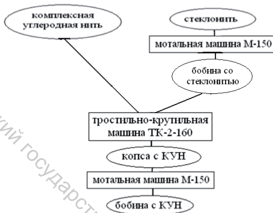
Рисунок 2 – Принципиальная схема получения КУН с тростильно-крутильного оборудования

При использовании технологии получения комбинированной нити на тростильно-крутильной машине углеродная составляющая в большей степени подвергается воздействию направляющих гарнитур, вследствие этого периферийные элементарные нити в структуре комплексной разрушаются.