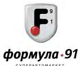
Рисунок 2 - Трехмерные объемные знаки: а) Компания Wacom, производитель графических планшетов и дисплеев; б) Мытищинский авторынок Формула 91

Трехмерность позволяет логотипу выбиться из массы плоских и однотонных коллег. 3D эффекты очень сильно привлекают внимание, они выявляют и подчеркивают новую эстетику в знакообразовании.