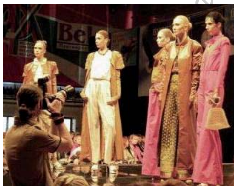
Авторская коллекция. Фото с показа.