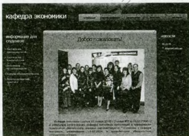
Рисунок 1 – Главная страница сайта кафедры экономики УО «ВГТУ»

Раздел «состав кафедры». В данном разделе доступны персональные странички преподавателей кафедры.