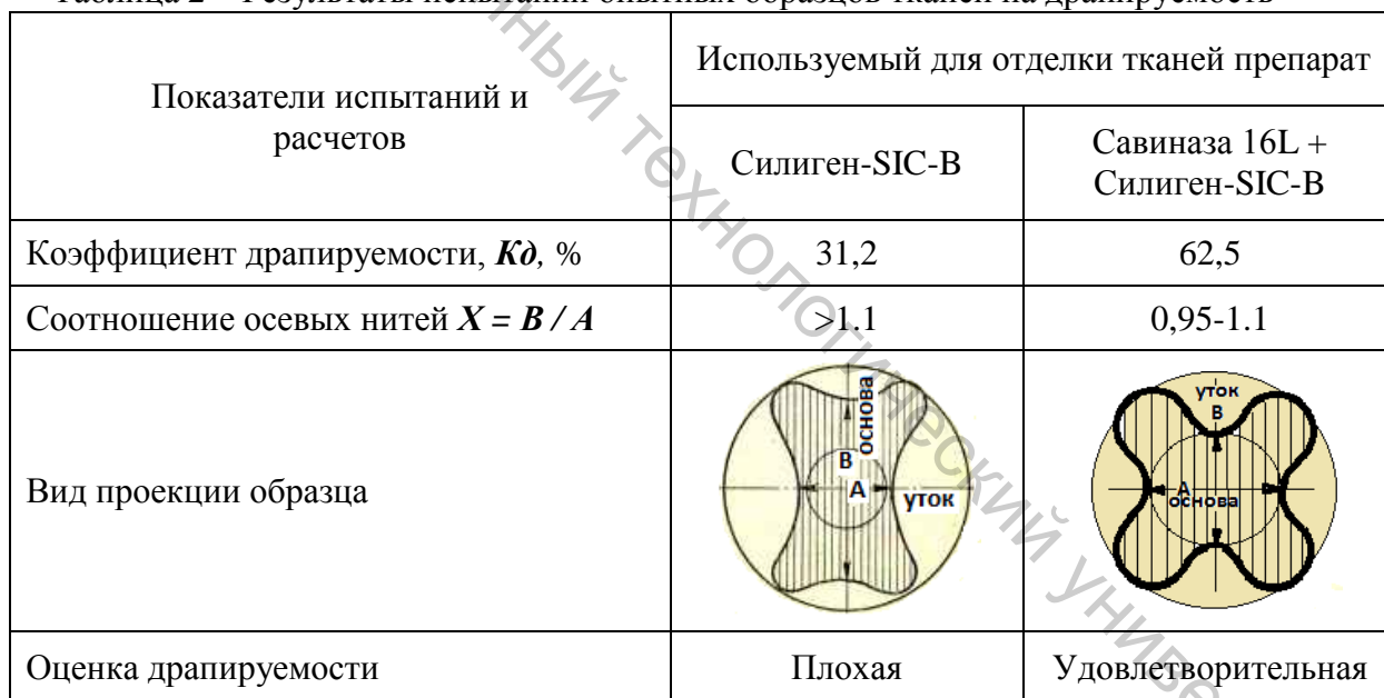
Таблица 2 – Результаты испытаний опытных образцов тканей на драпируемость

Жесткость полотен определяли по методу консоли на приборе ПТ-2 в соответствии с ГОСТ 10550–93 «Материалы текстильные. Полотна. Методы определения жесткости при изгибе». Результаты исследований представлены в таблице 3.