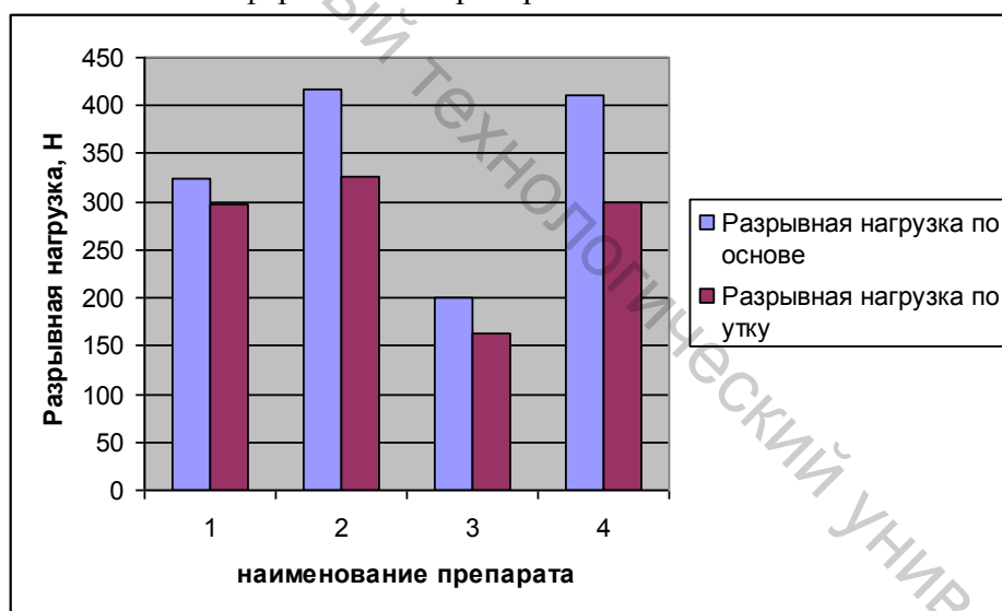
Рисунок 2 – Результаты исследований разрывной нагрузки образцов суконной ткани после обработки ферментами препаратами: