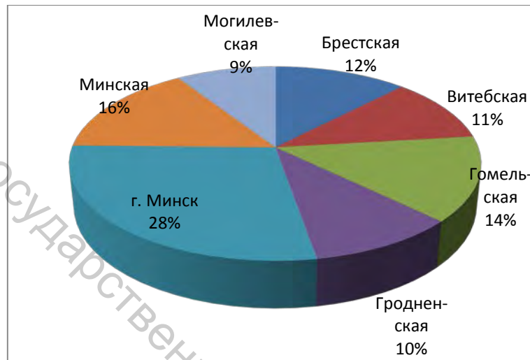
Рисунок 1 – Доля ВРП областей в ВВП Республики Беларусь в 2009 году

Важнейшим результатом и показателем развития региона является валовой региональный продукт. Динамика ВРП показывает результативность работы региона и отражает процессы дифференциации экономического развития регионов и областей. Анализ динамики ВРП по Беларуси свидетельствует об определенной неравномерности экономического развития. За прошедшие семь лет ВРП по областям вырос в среднем в 5,5 раза по Могилевской области, в 5,6 раза по Гомельской, в 5,7 раза по Брестской, в 5,8 раза по Витебской области. В то же время по Минску за семь лет ВРП увеличился в 7 раз, а по Минской области в 7,6 раза. Как следствие, существенно изменяется доля регионов в ВВП республики (рисунки 1, 2).