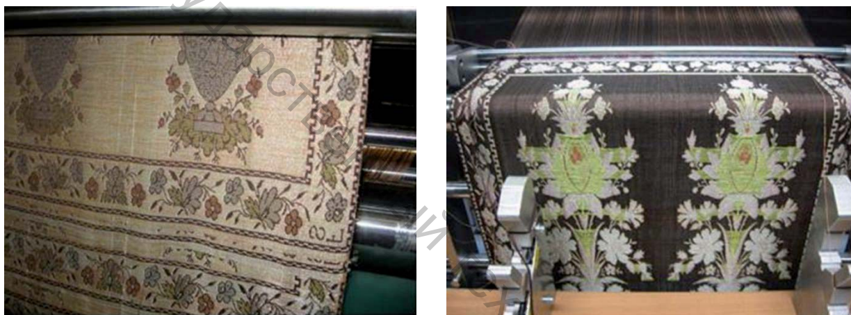
Рисунок 4 – Изготовленная копия пояса на станке (лицевая и изнаночная стороны)

Пояс выработывался лицом вниз, что способствовало лучшим условиям для нитей основы. Изготовленный пояс аутентичен лионскому поясу слущкого образца (рис.4).