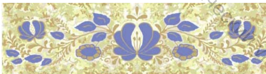
Рисунок 2 – Эскиз мотива узора тканого скатертного полотна

Для разработанной ткани столового назначения принято название «Цветочная рапсодия». Рапсодия (от греч. — эпическая песнь) — инструментальное или вокальное произведение, написанное в свободном, «импровизационном» стиле. Для рапсодии характерно чередование разнохарактерных эпизодов на народно - песенном материале. Поэтому и наша ткань представляет собой сочетание разнохарактерных растительных элементов в свободном стиле, которые невозможно увидеть одновременно в дикой природе, а на нашем полотне они удачно сочетаются и играют свою симфонию. В качестве цветового решения выбрана монохромия — использование одного тона или тональных градаций какого-либо единственного цвета.