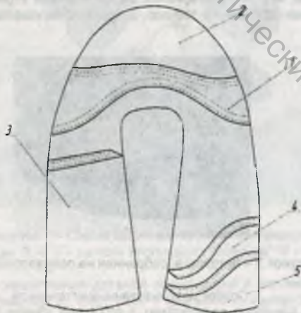
Рисунок 1 – Схема заготовки верха туфлей дошкольных

Проектирование пазов, вырезов и контура, подготовка управляющих программ к полуавтомату ПШ-1 выполнены с помощью системы автоматизированного проектирования и изготовления оснастки и подготовки управляющих программ к швейному полуавтомату (САПРИО и ПУП) [2].