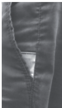
Рисунок 2 – Вид входа кармана брюк с усилительным материалом