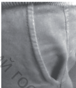
Рисунок 1 – Вид внутренней, продольной складки у входа кармана брюк

При этом лучше, чтобы вспомогательный материал соответствовал материалу кармана. Ясно, что закрепленный карман с трех сторон не может передвигаться и тем самым ликвидируется возможность образования каких-либо складок во внутренней части кармана. Следует отметить, что для достижения этой цели возможны и другие технические решения.