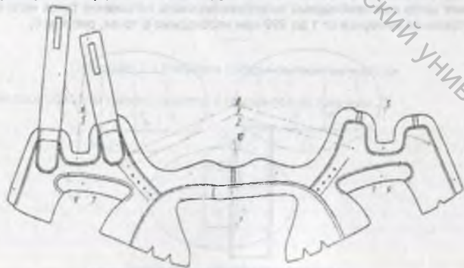
Рисунок 1 – Заготовка полупары верха обуви модели 24142

Проектирование пазов, вырезов и контуров, а также подготовка управляющих программ к полуавтомату ПШ-1 выполнены с помощью системы автоматизированного проектирования и изготовления оснастки и подготовки управляющих программ к швейному полуавтомату (САПРИО и ПУП) [2].