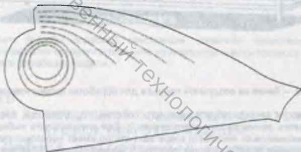
Рисунок 1 – Ажурные строчки в площади заготовки

Ажурные строчки можно разделить на две группы. Первая группа представлена на рисунке 1. Это строчки, которые прокладываются в площади детали, независимо от расположения ее края. Вторая группа строчек представлена на рисунке 2. Строчки второй группы прокладываются в площади детали эквидистантно ее краю.